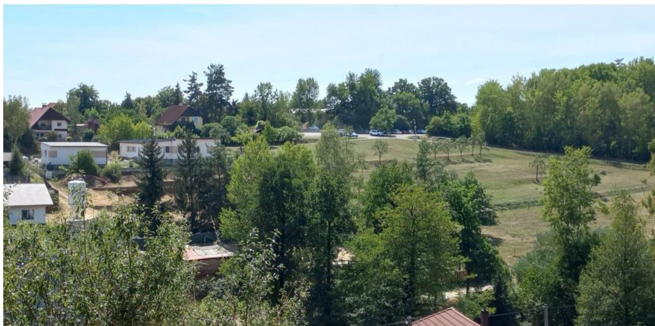
pohled na lokalitu se stanovenými regulačními prvky