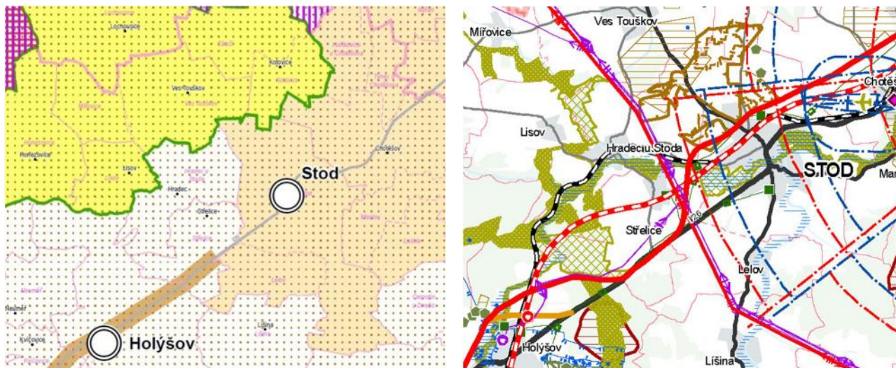
Výřez z výkresu Uspořádání území kraje ze ZÚR PK (vlevo)

Řešené území není součástí rozvojového území, neprochází jím ani rozvojová osa dle ZÚR PK. Z jihozápadu sousedí s vybraným rozvojovým územím města Holýšov, ze severozápadu sousedí se specifickou oblastí Sedmihoří a z východu přiléhá k řešenému území rozvojová oblast Plzeň. V blízkosti jižně od řešeného území prochází rozvojová osa OR4. Řešené území je zařazeno do specifické oblasti SOB9 , ve které se projevuje aktuální problém ohrožení území suchem. Dále je řešené území součástí vymezené krajiny KR11 Stříbrská pahorkatina, se stanovenými cílovými kvalitami.