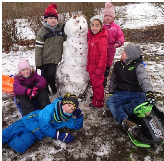
Sněhulák – strážce školní zahrady