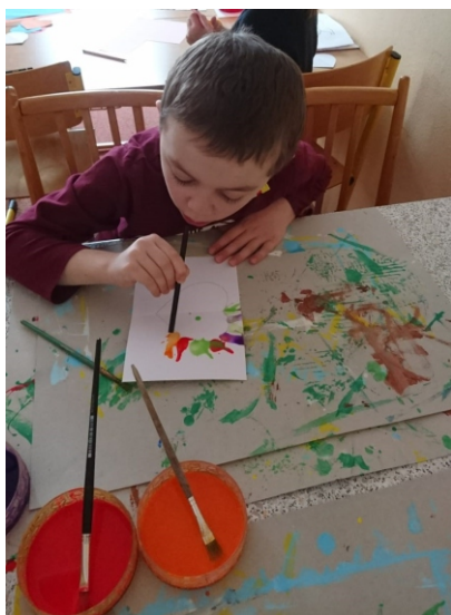
Výroba přáníček na sv. Valentýna