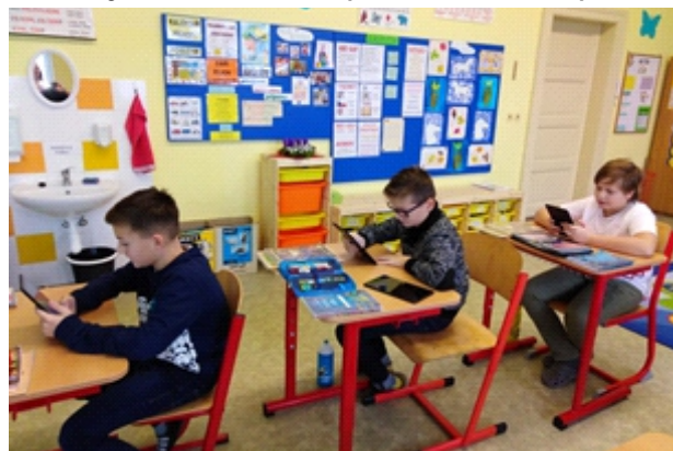
Obrázek: výuka matematiky s tablety Samsung